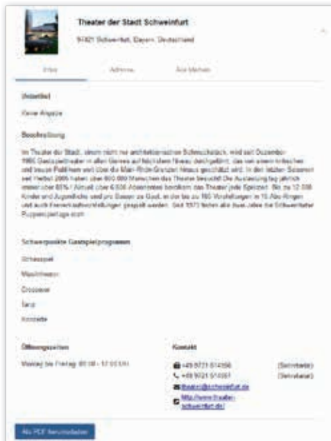
Eintrag einer Gastspielproduktion